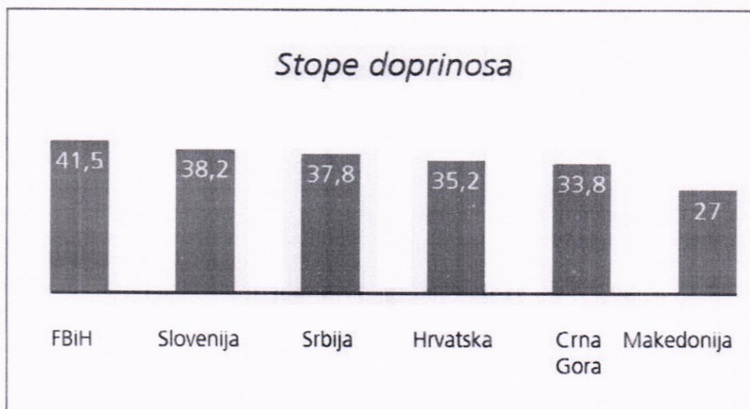
Slika 1.2. Stopa doprinosa u FBiH

Uvođenje novih poreza ili izmjena postojećih: Na primjer, reforma poreza na dohodak i dobit, povećanje ili smanjenje poreza na dodatu vrijednost (PDV) - na nivou države, ili uvođenje